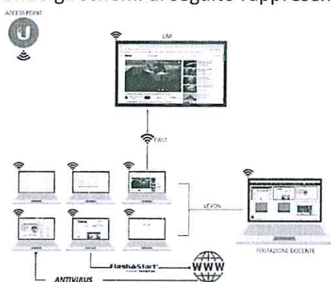
Ambiente gestito con Veyon

Tale fornitura, andando ad implementare quella già a disposizione, servirà a creare ambienti innovativi interconnessi, per l'implementazione del Cooperative Learning e delle metodologie didattiche attive secondo gli schemi di seguito rappresentati.